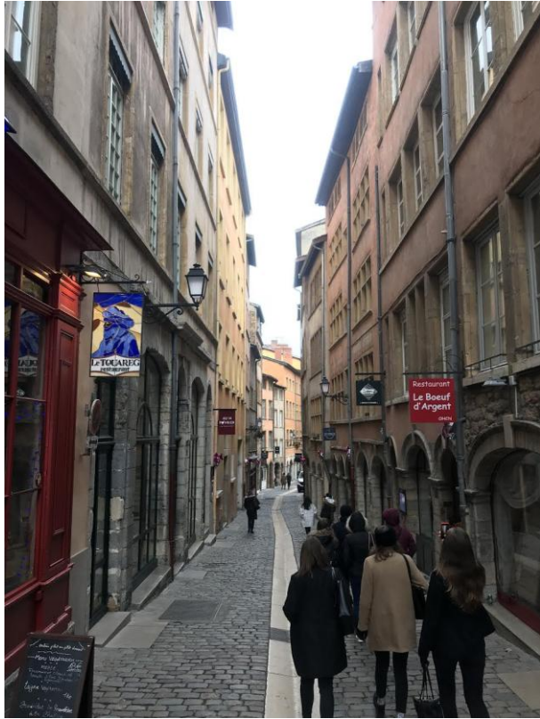
Une rue du vieux Lyon