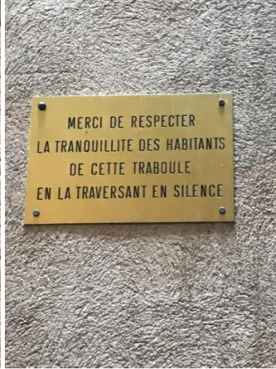
Notre guide qui nous ouvre le passage d'une traboule

Naika et Léa, deux élèves de première ES